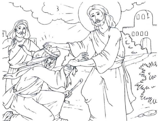
Jesus tut wunder und heilt Menschen