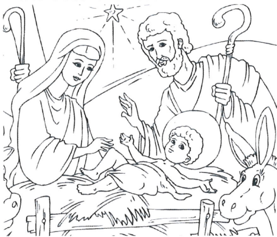
Die Geburt von Jesus Christus