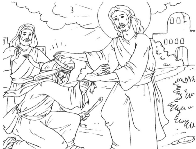
Jesus tut wunder und heilt Menschen