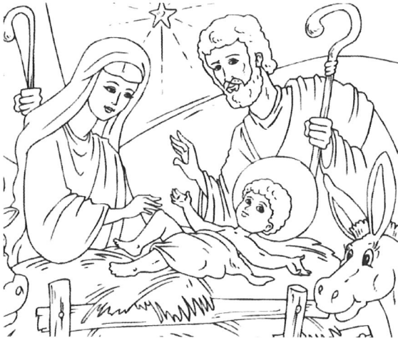
Die Geburt von Jesus Christus